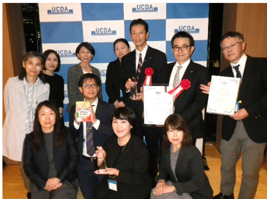
6部署から集まったプロジェクトメンバー

ハウス食品は、11月9日に開催された、優れたコミュニケーションデザインを実現した製品や、企業におけるユニバーサルコミュニケーションデザインの推進体制を表彰する『UCDAアワード2023』において、「マカロニグラタンクイックアップ」が「情報のわかりやすさ賞」、企業の活動として「総合賞 シルバー」を受賞しました。